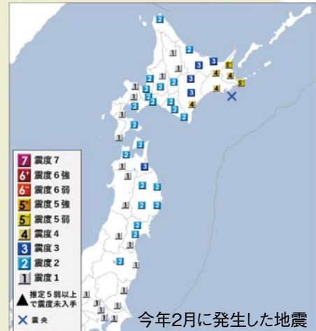
2月25日22時33分発表

窓リノベ、こどもエコすまい支援事業は、かなりの問い合わせがあり、3月31日より申請が始まりました。住まいの不安、不満を補助金でうまく活用し解消したいものです。さてここ最近では地球温暖化防止がキーワードとなり、断熱性向上の施策に目を向けてきました。これは業者サイドの話ですが、設計申請の審査、構造計算など住宅に関わる基準が厳しくなっています。いままでは積雪荷重、地盤の強度だけでした。しかしこの先は建物の重さに関わる強度なども新たに取り入れられるような流れになっています。最近では2月25日に釧路沖を震源とする地震が発生しました。規模はM6.0で最大震度5弱でしたが、津波の心配もなく被害も少なかったようです。しかしこの地震は広範囲に揺れを起こしました。私たちの住む江別でも震度2を記録しました。北海道の現状を踏まえ、いつ起きても不思議ではない大震災に備える必要があると思います。