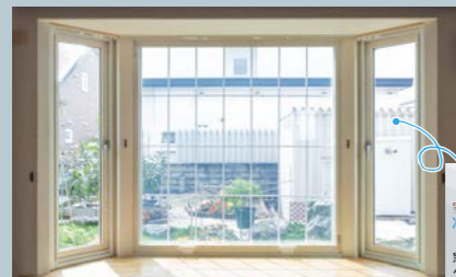
2021~23年春まで 灯油消費量は格子付きガラスの内側にFIXの内窓を取り付けした状態での測定

23年と24年の違いはリビングの内窓の取り付け位置と、24年は2階の寝室に内窓を取り付けした事です。まずリビングの内窓の取り付け位置は、FIX部分の空気層内が非常に高温になる事から、台形部分の手前に移動しました。そうすることにより日中、台形出窓内の温度は上がりますが、気にするほどの温度にはならず、朝方測定したガラスの表面温度も平均20.2℃と、コールドドラフトを起こすことも少なく、非常に快適な温度環境になった様です。