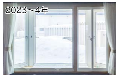
2023~4年 台形部分の手前に内窓を取り付けすると、外部側のガラスが結露する事が多いのですが、多少の結露は発生しましたが、この大きな空気層が功を奏したのか？コールドドラフトによる、足元の寒さ感減少に繋がりました。